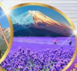
โออิชิ ปาร์ค