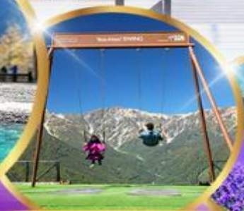
ชิงช้า Yoo hoo! Swing