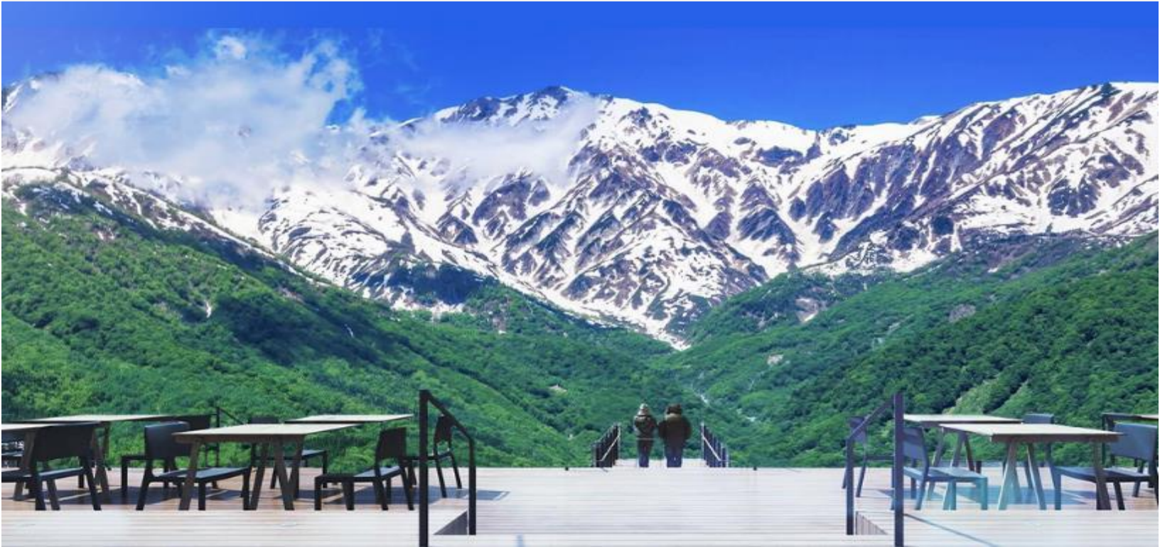
HAKUBA MOUNTAIN HARBOR

ไม่พลาดกับการชมวิวแบบพาโนรามา ณ Hakuba Mountain Harbor ด้วยทัศนียภาพที่เหนือชั้นของภูเขาโดยรอบ จุดเด่น คือ ระเบียง “Hakuba Sanzan” ที่สามารถเห็นเทือกเขาแอลป์แบบ 360 องศา ได้อย่างสวยงามในทุกฤดู สามารถยืนถ่ายรูป และดื่มด่ำกับบรรยากาศได้อย่างเต็มอิม ในบริเวณเดียวกันยังมีร้านเบเกอรี่ โดยทางเข้ามีที่นั่งบนระเบียง สามารถเพลิดเพลินไปกับการจิบเครื่องดื่มอุ่น ๆ พร้อมชมบรรยากาศตามอัธยาศัย