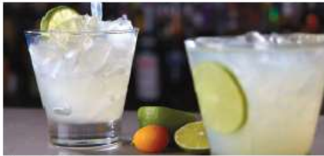
The A-List Bar

The perfect spot to sip a handcrafted cocktail and enjoy the performances from inside The Manhattan Room. Seating capacity: 20