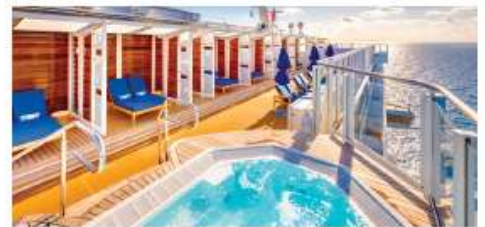
Vibe Beach Club

An adults-only private retreat with stunning views, oversized hot tub and full-service bar. Seating capacity: 60