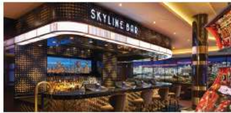
The Skyline Bar