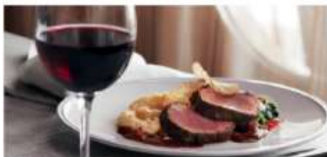
The Manhattan Room

One of three Main Dining Rooms, The Manhattan Room is where guests can enjoy specially curated modern and classic dishes made with the freshest ingredients. Seating capacity: 560