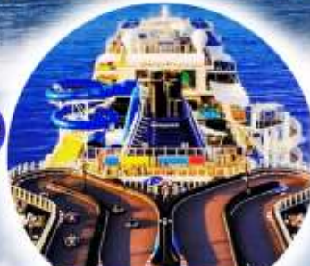
ซิปโกลคาร์ทบนเรือ