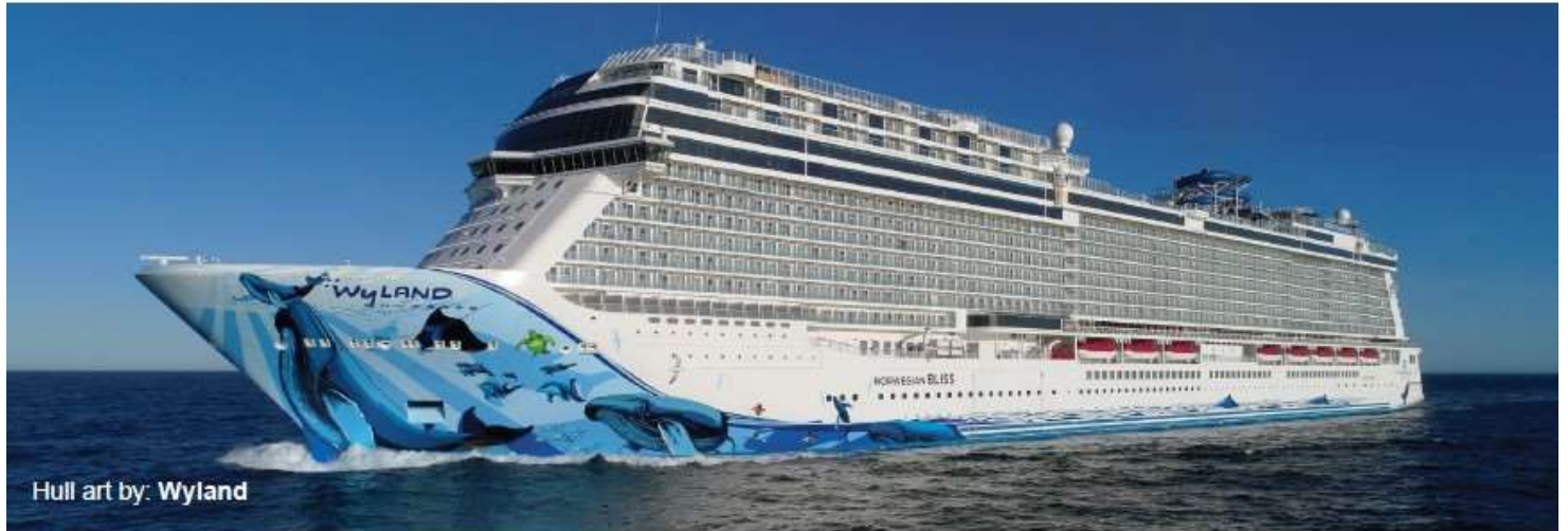
Hull art by: Wyland

Built: 2018 • Gross Tonnage: 168,028 • Guests (Double Occupancy): 4,004 • Overall Length: 1,094ft • Max Beam: 136ft • Crew: 1,716