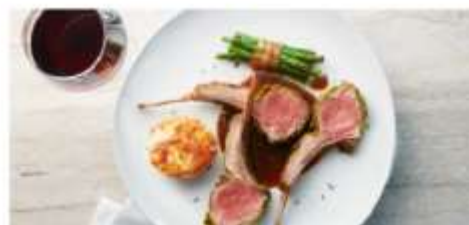
The Haven Restaurant

Savor an exclusive array of dishes for breakfast, lunch and dinner in a private restaurant serving the finest cuisine. Enjoy stunning vistas indoors or al fresco. Exclusively for guests of The Haven. Seating capacity: 98