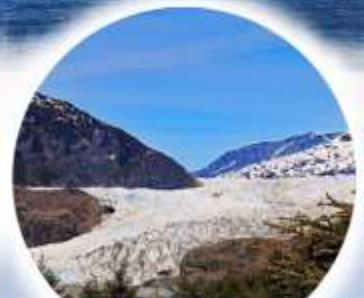
ธารน้ำแข็งเมนเดนฮอลล์

พิเศษ!! รับประทาน Salmon Bake และเครื่องดื่มต่างๆไม่อื่น