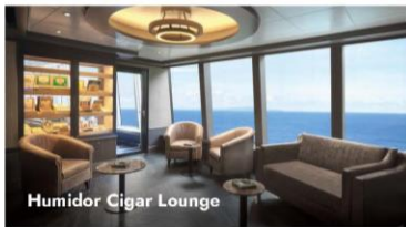
Humidor Cigar Lounge

Bring your favorite whiskey cocktail into The Humidor Cigar Lounge to pair with a good smoke. With comfortable leather chairs and a fully-stocked humidor, this is the ideal setting to recline and connect with friends, both new and old. Seating capacity: 10; Reception capacity: 18