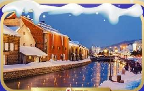
คลองโอดารุ