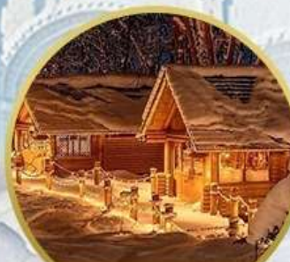
นิงเกิ้ลเทอรส